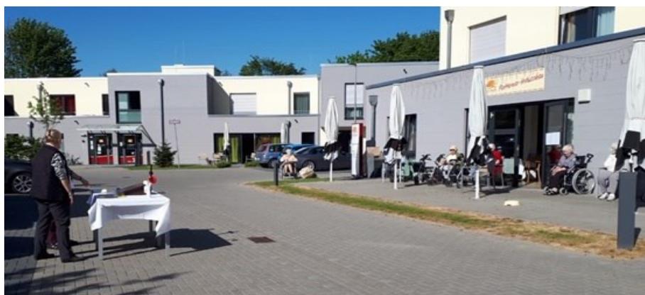
Wortgottesfeier im Freien vor der Seniorenwohnanlage in Neu-Pattern

An einem der ersten heißen Sommertage der letzten Wochen erinnerte ich mich an eine Kindheitserfahrung, die mir als aufregend und spannend im Gedächtnis geblieben ist: im gedankenlosen Spiel mit einer groben Glasscherbe entdeckte ich, wie die Buchstaben der unter ihr liegenden Zeitung zunächst vergrößert zu lesen waren, dann, wie sich das Stück Papier plötzlich an einem Punkt verfärbte und zu brennen begann. Die wertlose, unbedeutende Scherbe als Lupe und als gefährliches Brennglas! Bekanntlich hinken Vergleiche, aber auch hinkend kann man sich ja fortbewegen und einem Gedanken nähern: ist es mit der Pandemie, die immer noch und voraussichtlich noch lange in vielen Bereichen unseren Alltag bestimmen wird, ist es mit dem Virus nicht ganz ähnlich wie mit einer solchen Glasscherbe? So viel alltäglich Gewohntes, Selbstverständliches, unreflektiert und gedankenlos konsumiert, erscheint uns jetzt plötzlich unter der Coronalupe in einem veränderten Licht, als fragil, als verletzlich und bedroht: Die Schöpfung und unser Umgang mit ihr, unser unbedachter Massen- und Billigkonsum, aber ebenso der Wert von Freundschaft und Beziehung, von menschlicher Nähe und nachbarschaftlicher Solidarität. Und so wie sich gesellschaftlicher Alltag verändert, wie lieb gewonnenes Verhalten dringend in Frage gestellt werden muss, so gilt Gleiches auch für religiöse Gewissheiten und kirchliche Gewohnheit: Fehlt uns eigentlich etwas, ist