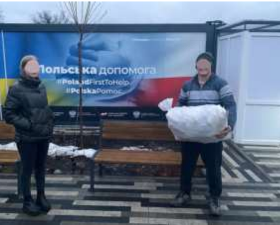
Container Camp in Irpin

Hier ein paar Foto-Impressionen aus der Ukraine: