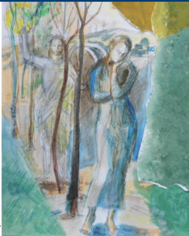
Grafik: Pia Foierl

Liebe ist anders – ein Aufbruch, befreiend, von Vertrauen getragen