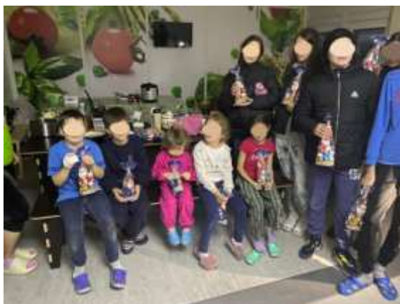
Container Camp in Irpin